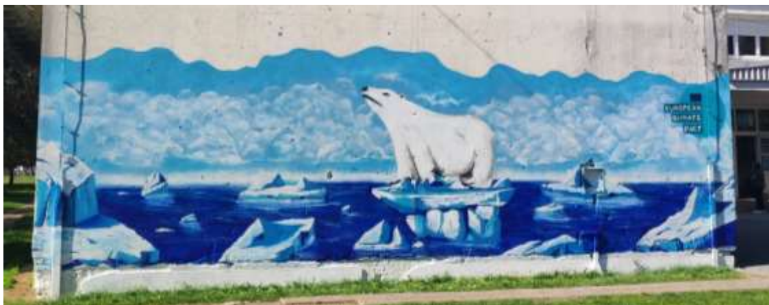
„Europski klimatski pakt“ - mural na vanjskom zidu škole, 2022. godina